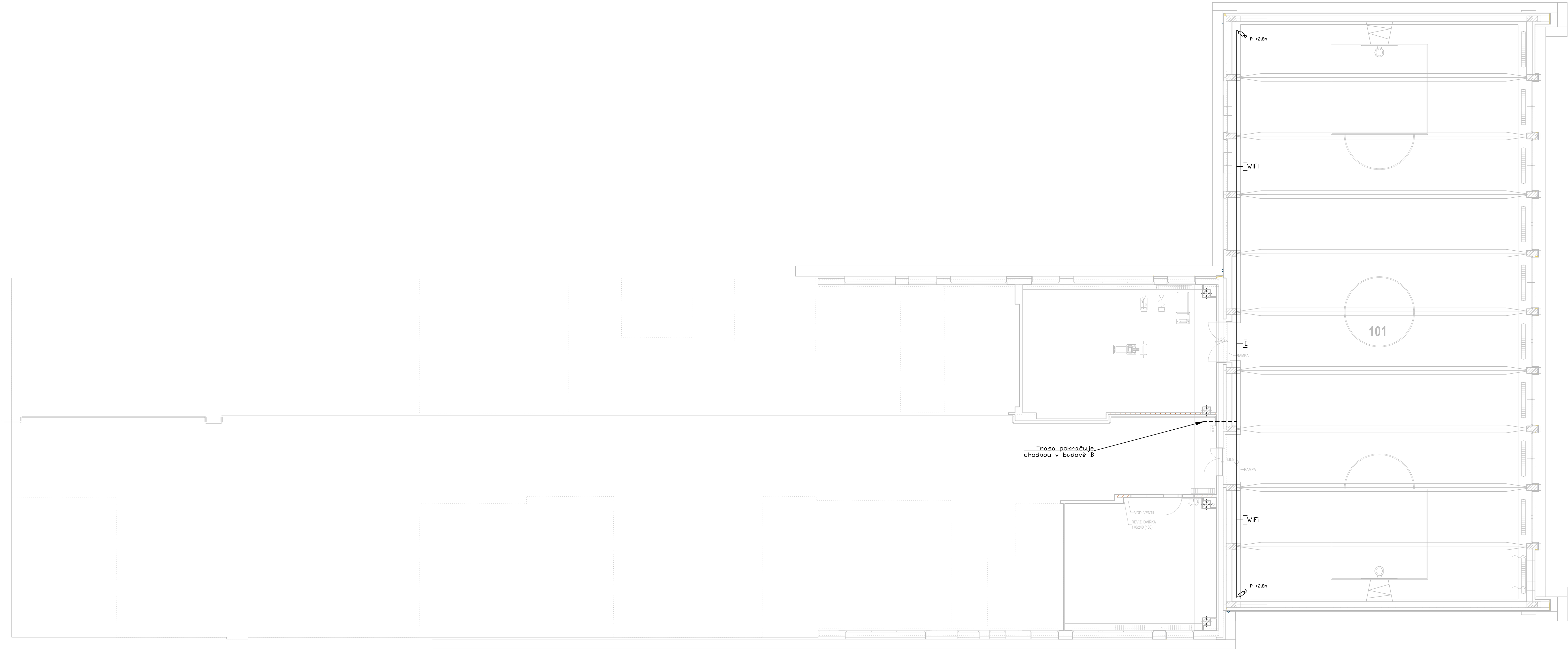
LEGENDA MÍSTNOSTÍ - BUDOVA C